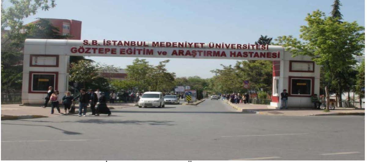
Resim: Sağlık Bakanlığı İstanbul Medeniyet Üniversitesi Göztepe Eğitim ve Araştırma Hastanesi binasından bir görünüm.