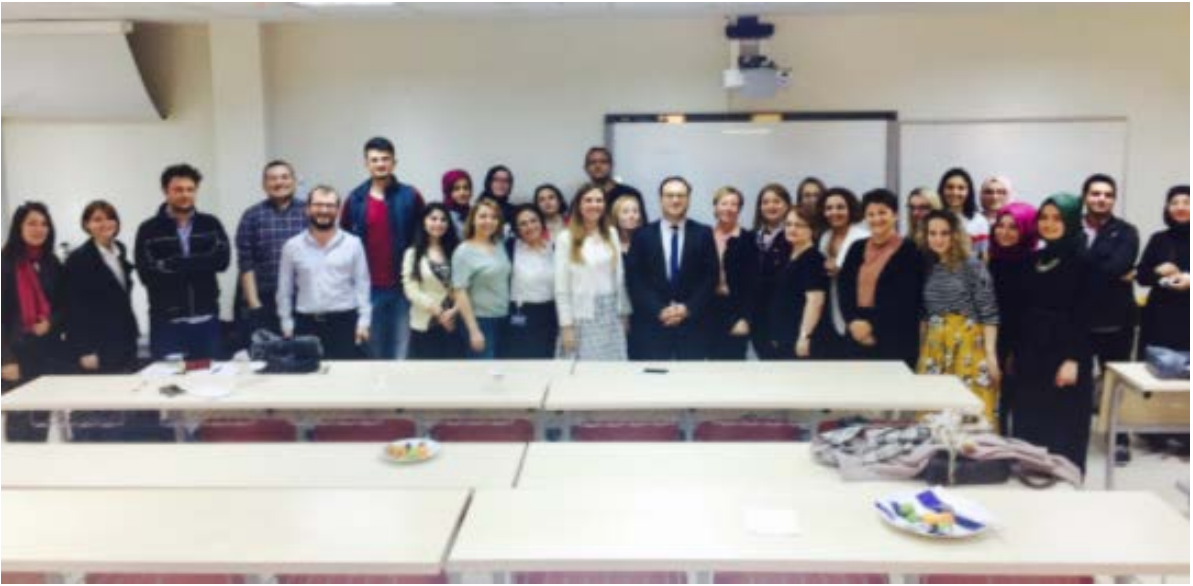
Resim : Halk Sağlığı Profesyonelleri toplantısından bir görünüm.