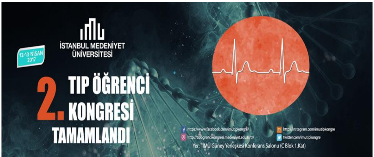
Resim: II. Tıp Öğrenci Kongresinin tanıtımı.

Fakültemiz öğrencilerine akademik danışmanlar belirlemiştir. Öğretim Üyeleri danışmanı oldukları öğrenciler için görüşme günleri belirlemiş olup belirlenen zaman dilimlerinde öğrencilerin talepleri üzerine görüşmeler yapmaktadırlar.