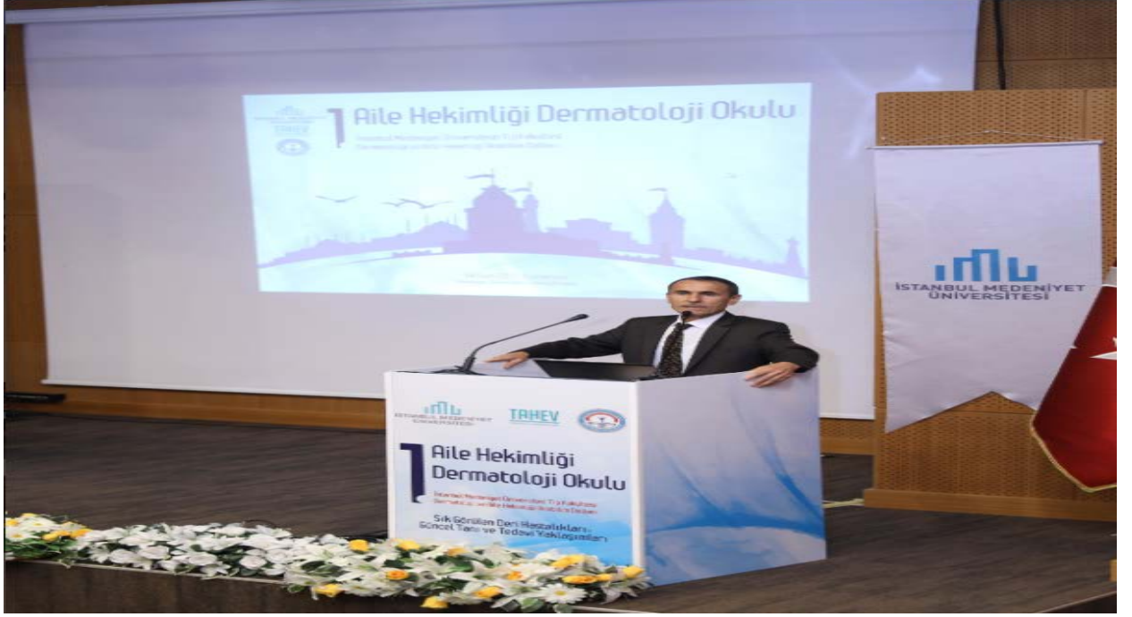
Resim: “1.Aile Hekimliği Dermatoloji Okulu”ndan bir görünüm.

✚ Fakültemiz, Deri ve Zührevi Hastalıkları ve Aile Hekimliği Anabilim Dalı Başkanlıklarının katkılarıyla düzenlenen “1.Aile Hekimliği Dermatoloji Okulu” 14 Ekim 2017 Cumartesi günü Üniversitemiz Güney Kampüsü konferans salonunda gerçekleştirildi.