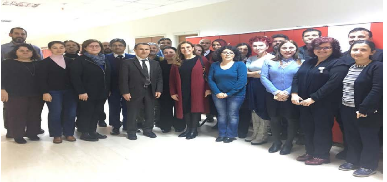
Resim: Probleme Dayalı Öğrenimden görünüm.

Performans Hedefi 18: Öğrencilerin, ilgili sektörlerde uygulamalı eğitim almalarının sağlanması.