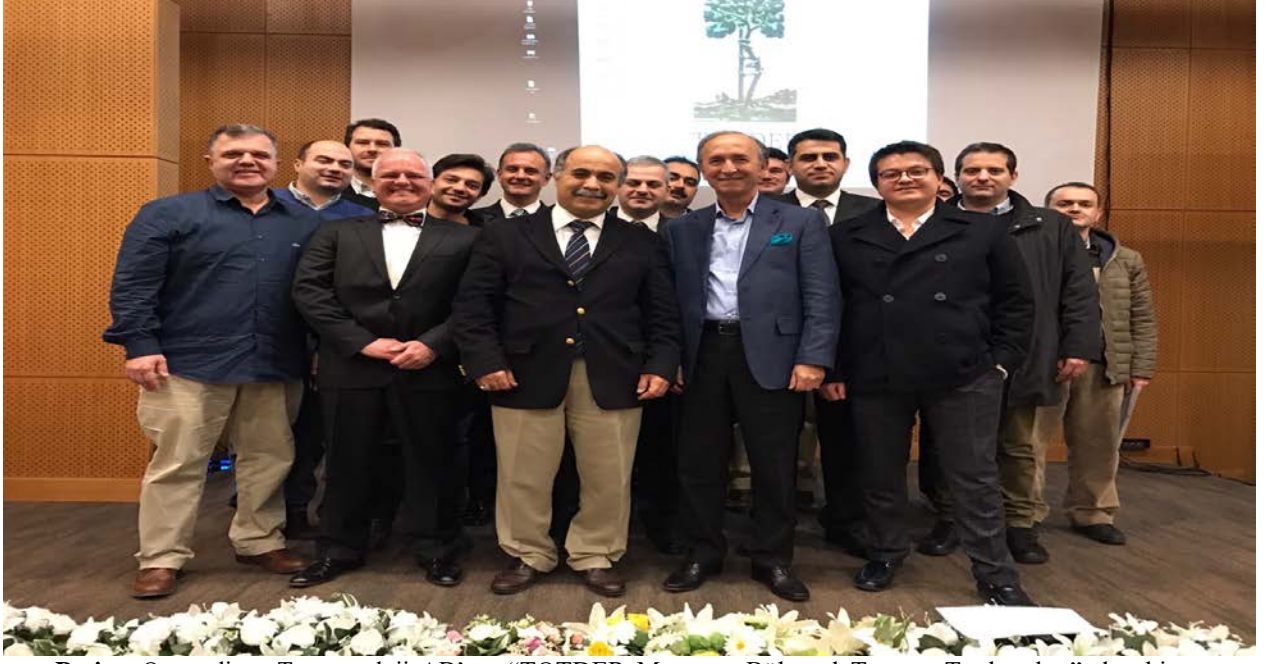
Resim: Ortopedi ve Travmatoloji AD'nın “TOTDER Marmara Bölgesel Travma Toplantıları”ndan bir görünüm.