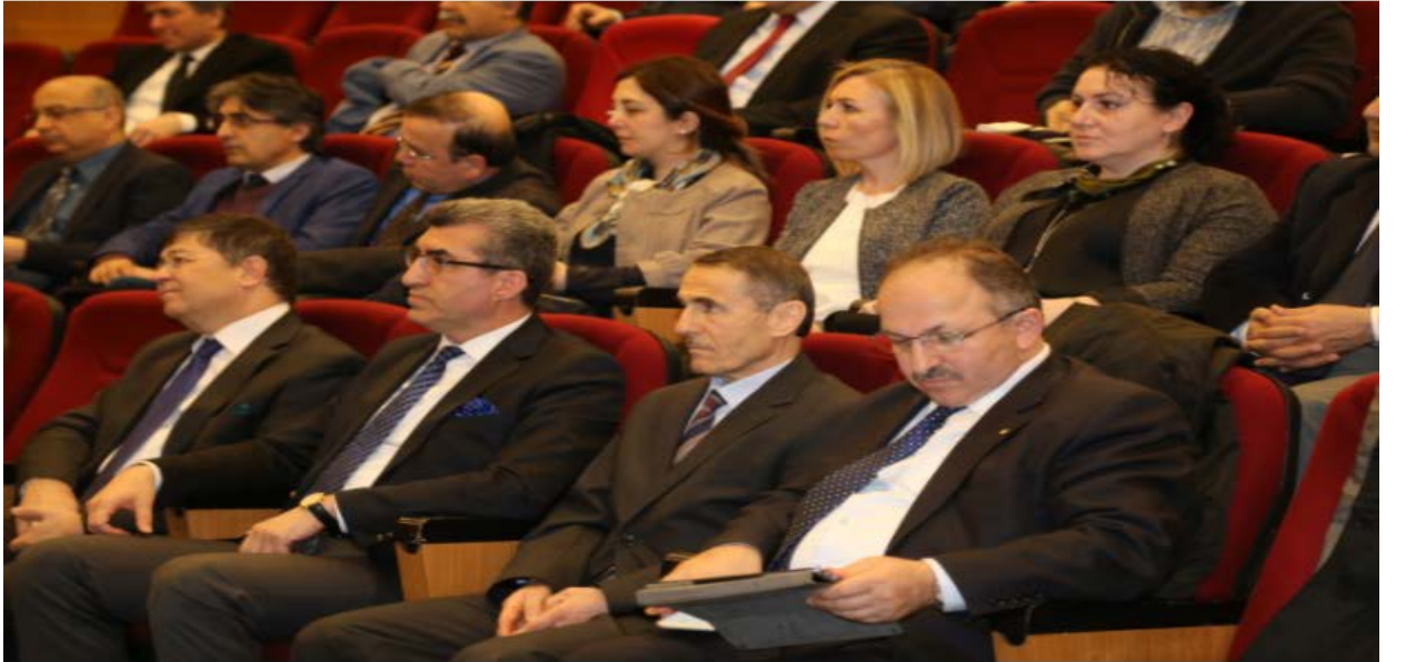
Resim: 14 Mart Tıp Bayramı Etkinliğimizden bir görünüm.