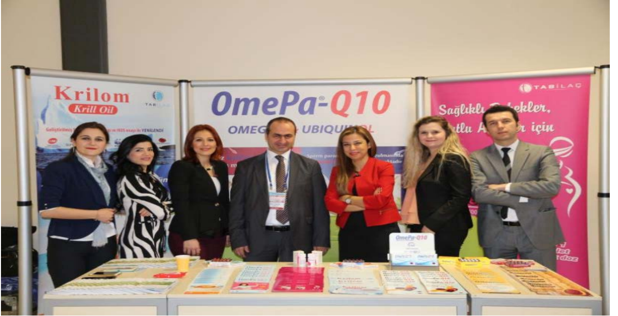
Resim: I. Kadın Hastalıkları ve Doğum Günleri” Kongresi’nden bir görünüm.