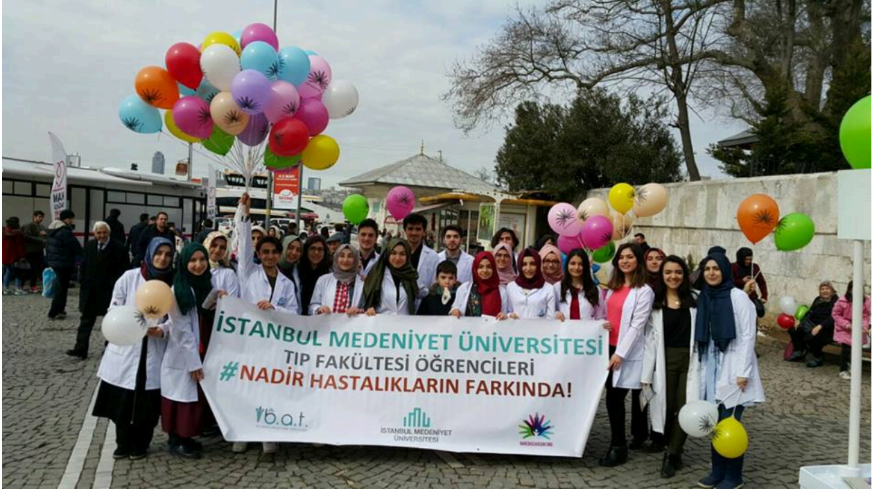
Resim: Nadir Hastalık Farkındalık Topluluğunca düzenlenen etkinlikten görünüm.