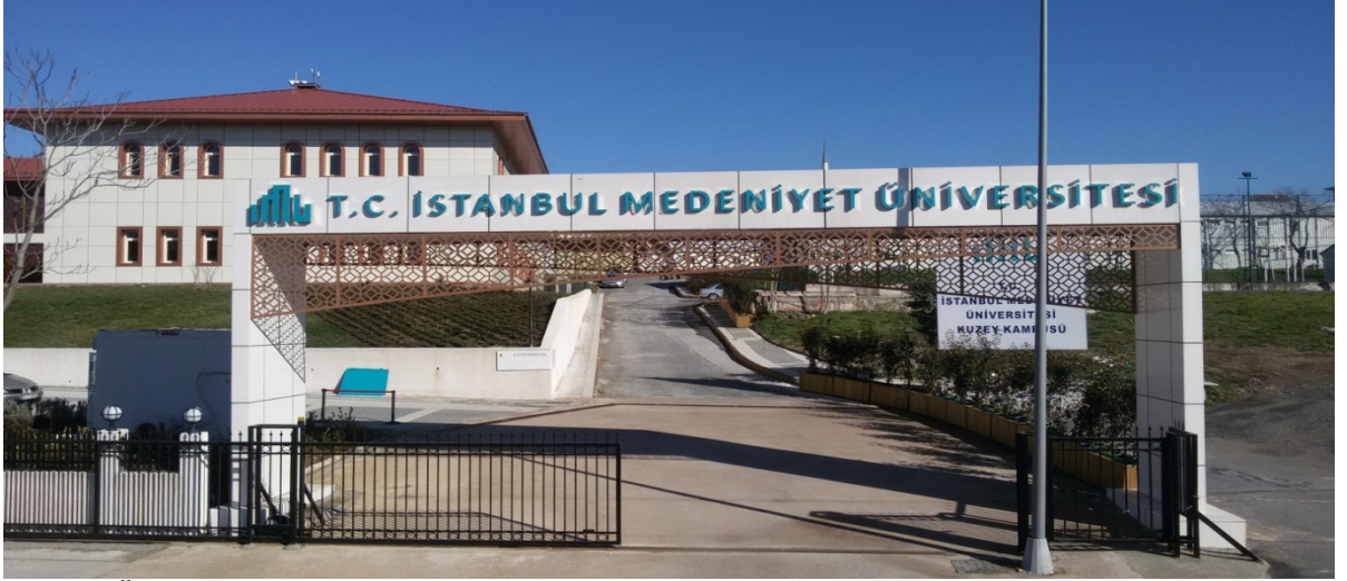
Resim: Üniversitemiz Kuzey yerleşke binasından görünüm.