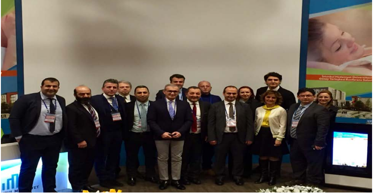
Resim: I. Kadın Hastalıkları ve Doğum Günleri” Kongresi’nden bir görünüm.