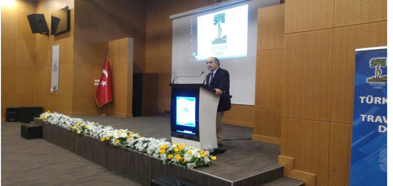
Resim: Ortopedi ve Travmatoloji AD'nın “TOTDER Marmara Bölgesel Travma Toplantıları”ndan bir görünüm.