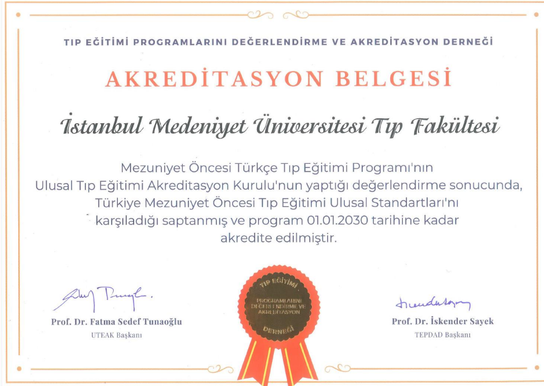
PG.1.3.4. : Akreditasyon Belgesi