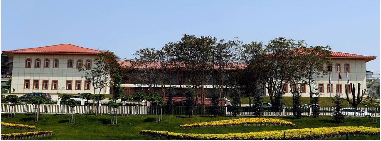
Resim: Üniversitemiz Kuzey yerleşke binasından görünüm