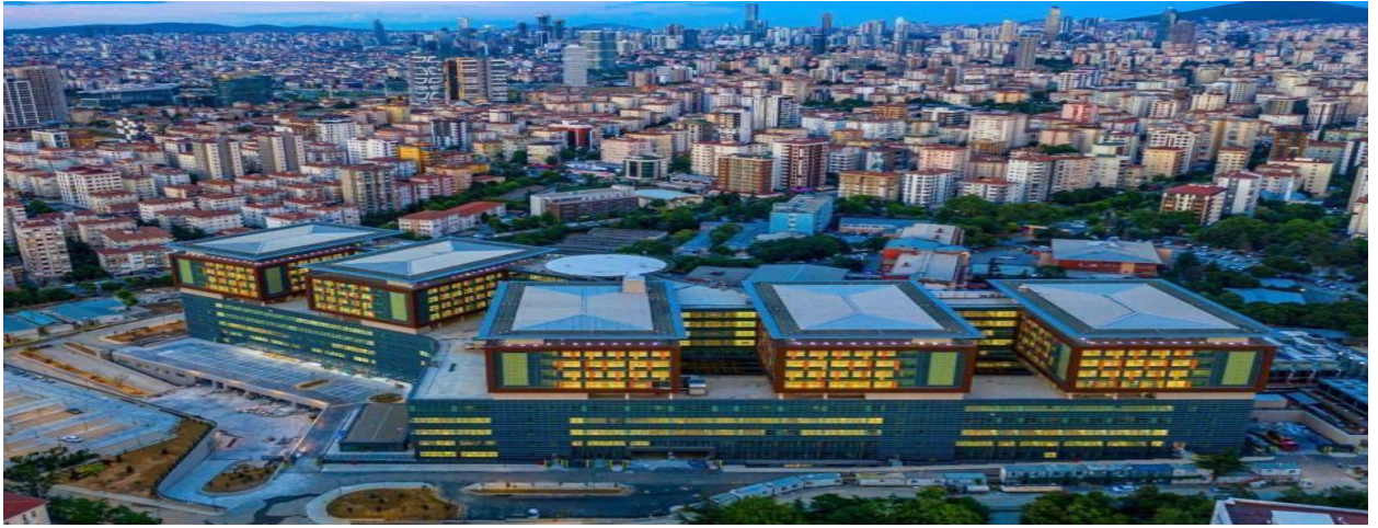
Resim: Sağlık Bakanlığı İstanbul Medeniyet Üniversitesi Göztepe Eğitim ve Araştırma Hastanesi binasından bir görünüm.