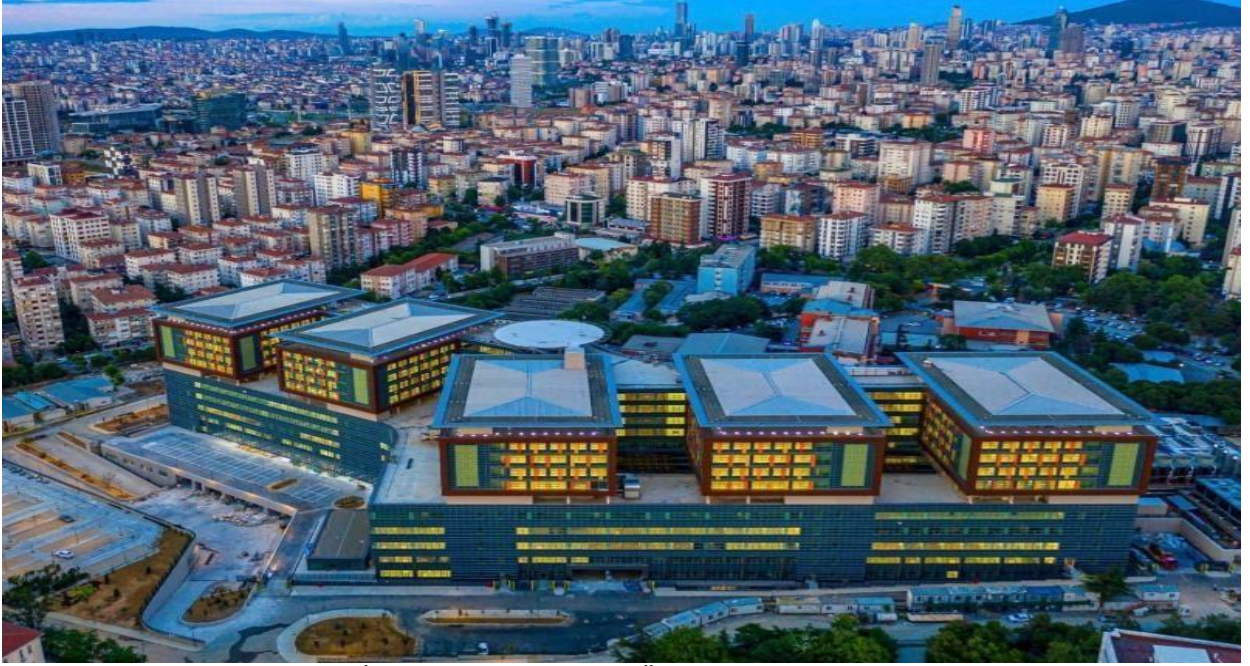
Resim: Sağlık Bakanlığı İstanbul Medeniyet Üniversitesi Göztepe Eğitim ve Araştırma Hastanesi binasından bir görünüm.