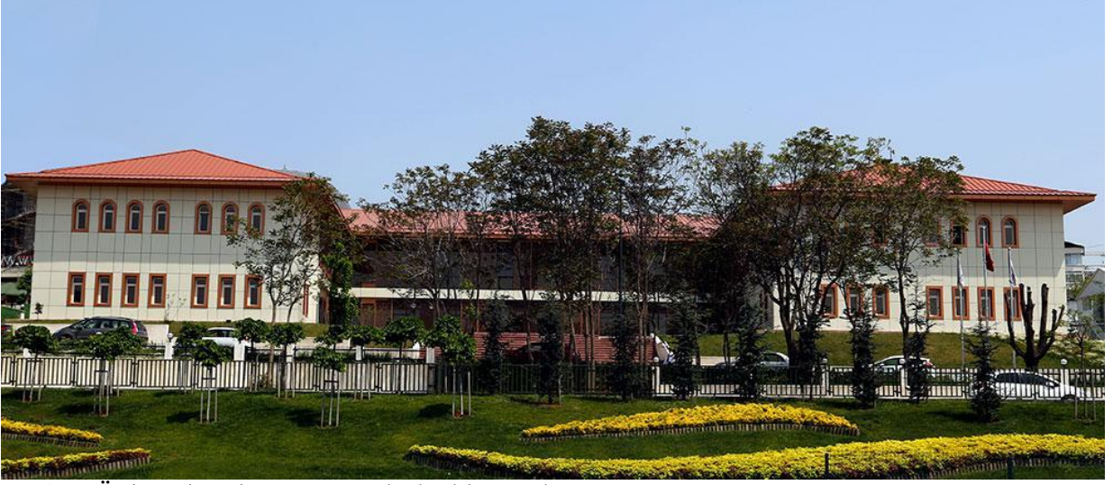
Resim: Üniversitemiz Kuzey yerleşke binasından görünüm.