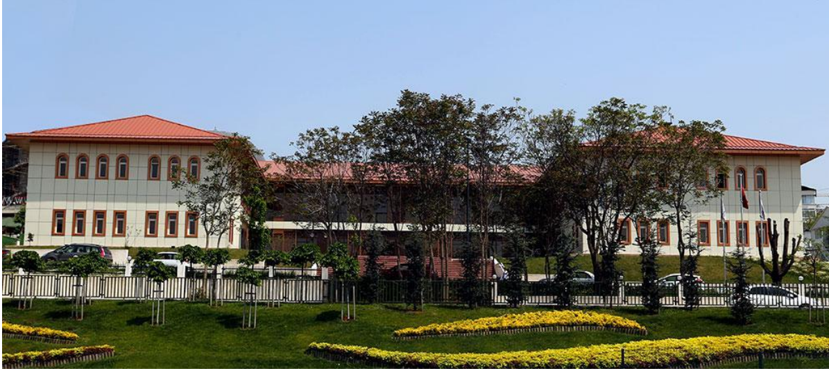
Resim: Üniversitemiz Kuzey yerleşke binasından görünüm.