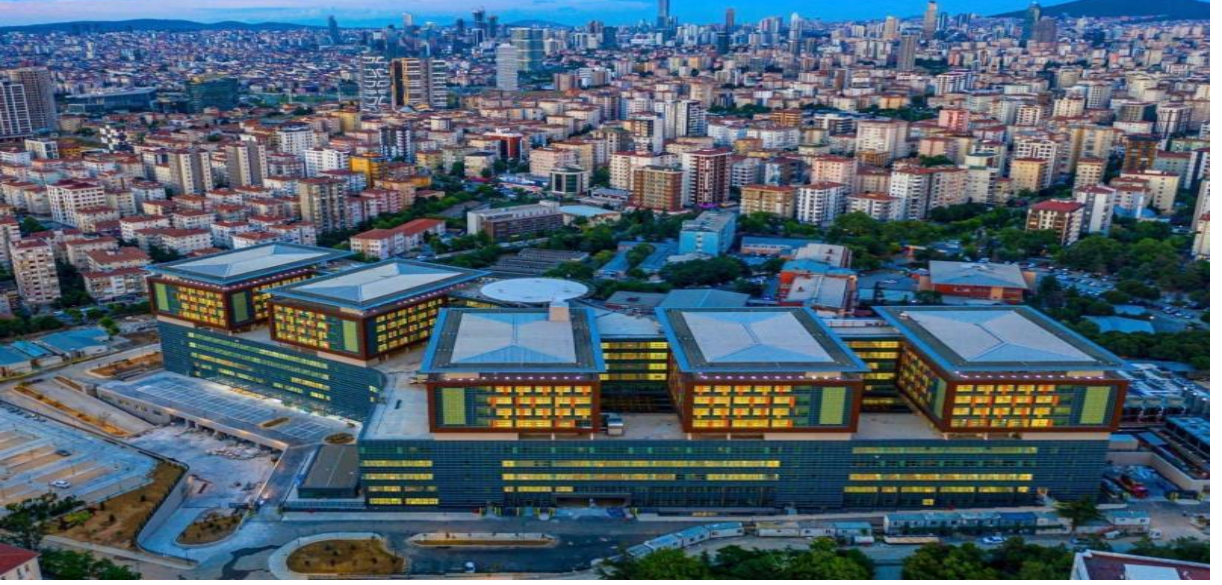
Resim: Sağlık Bakanlığı İstanbul Medeniyet Üniversitesi Gztepe Eğitim ve Araştırma Hastanesi binasından bir görünüm