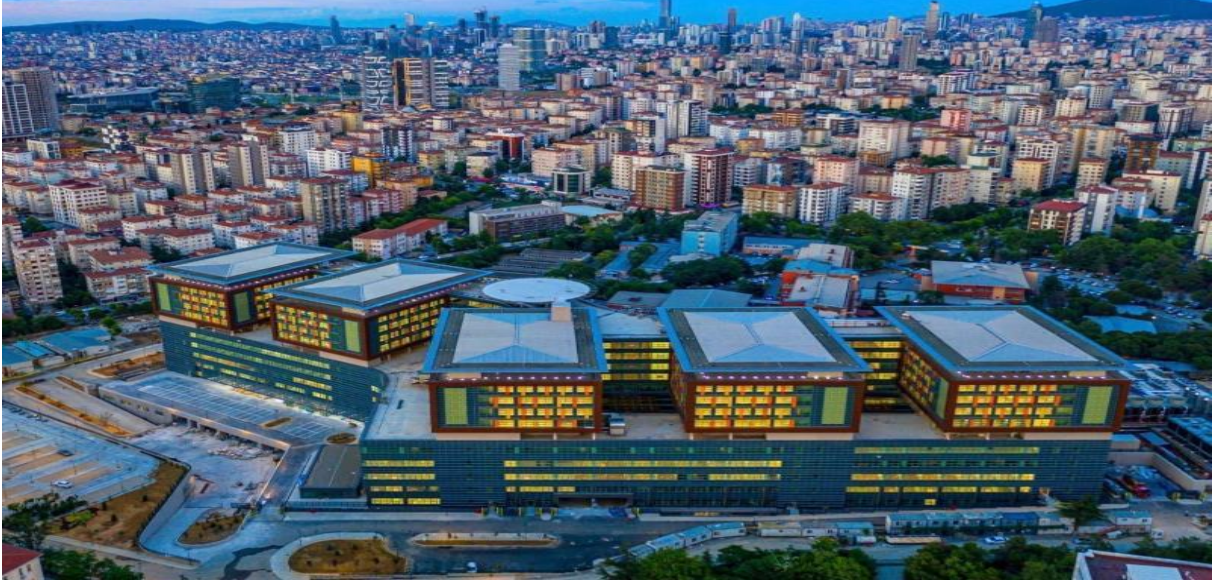
Resim: Sağlık Bakanlığı İstanbul Medeniyet Üniversitesi Göztepe Eğitim ve Araştırma Hastanesi binasından bir görünüm.