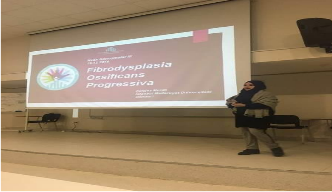
Resim: Nadir Hastalıklar Etkinliğinden bir görünüm.

Bu bağlamda Fakültemiz Nadir Hastalıklar Araştırma Kulübü tarafından 19 Aralık 2018 tarihinde "Nadir Konuşmalar Etkinliği" yapıldı. Etkinlik çerçevesinde her sene düzenli olarak gerçekleştirilen "Nadir Konuşmalar Etkinliği" yapıldı.