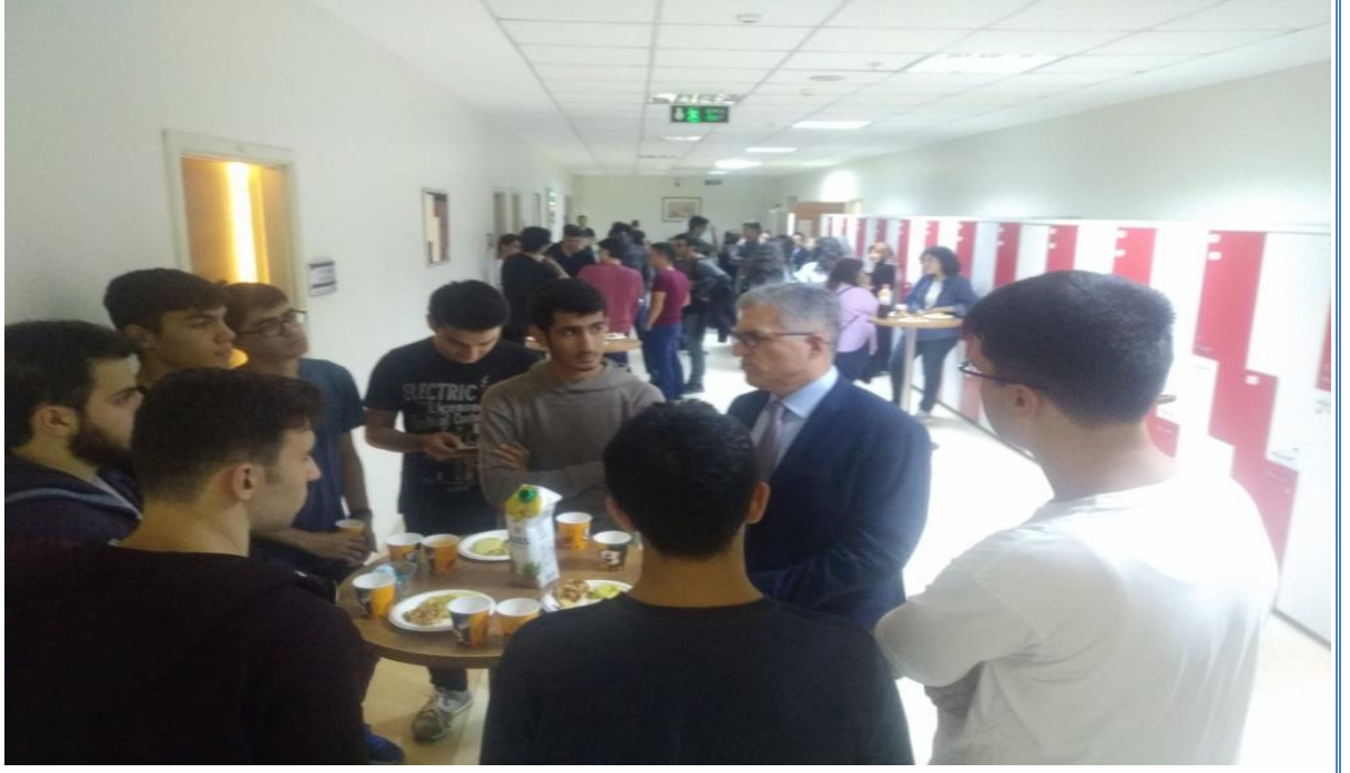
Resim: Dönem 1 Uyum Programından