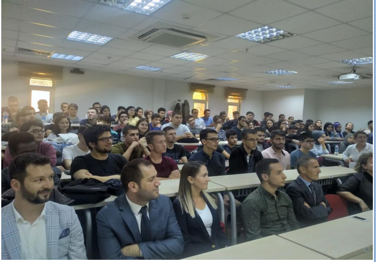
Resim: Dönem 1 Uyum Programından