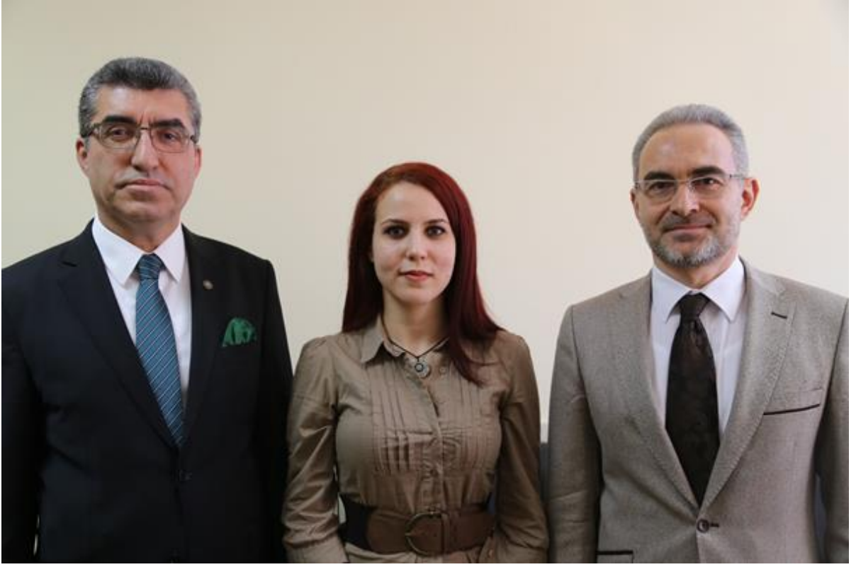
Resim: : Kadavra Bağışı Programından

14 Mart Tıp Bayramı'nda Fakültemiz Anatomi Anabilim Dalı'na kadavra bağışı yapıldı.