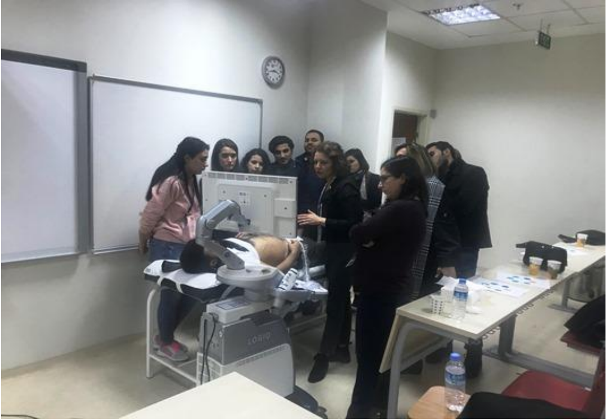
Resim: Anestezi Uygulamalarında Ultrason Kursundan bir görünüm.