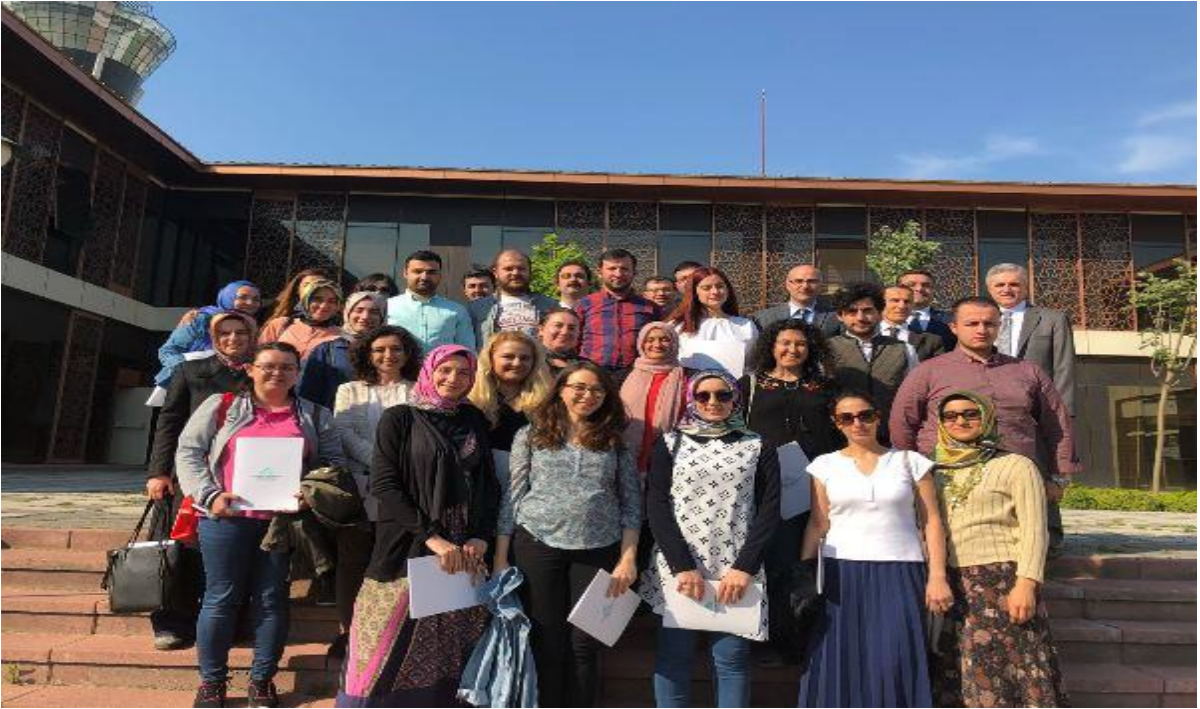
Resim: İstanbul Medeniyet Üniversitesi Uzmanlık Temel Eğitim Kursundan (MEDUTEK) bir görünüm.