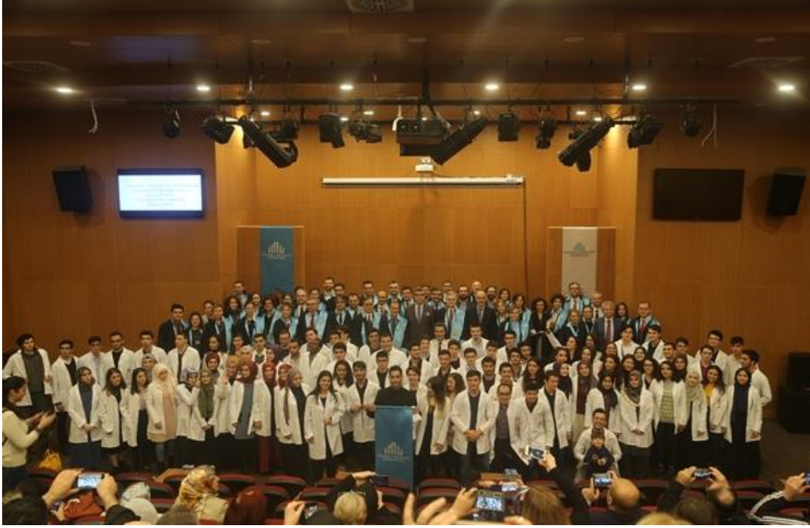
Resim: Önlük Giyme Töreninden görünüm.

2018-2019 Eğitim-Öğretim dönemiyle birlikte Tıp Fakültemizde 124 adet Dönem 1 öğrencimiz için 6 Aralık 2018 tarihinde Tıp Fakültesi Önlük Giyme Töreni gerçekleştirildi.