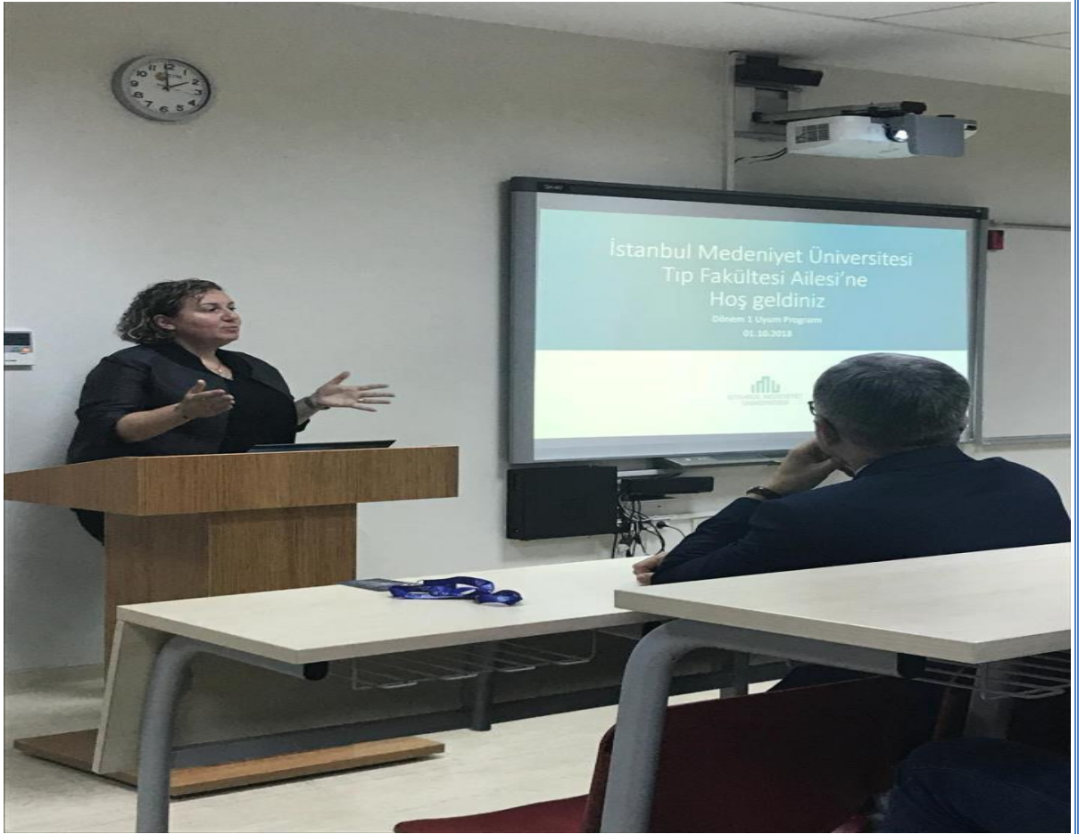
Resim: Dönem 1 Uyum Programından