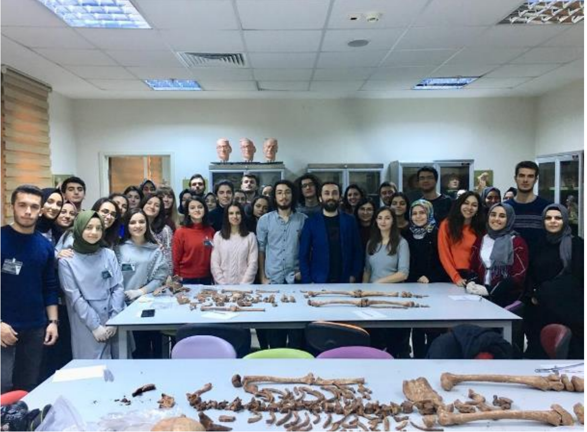
Resim: Adli Tıp Anabilim Dalı Başkanlığının gerçekleştirdiği Adli Antropoloji Atölyesinden bir görünüm.