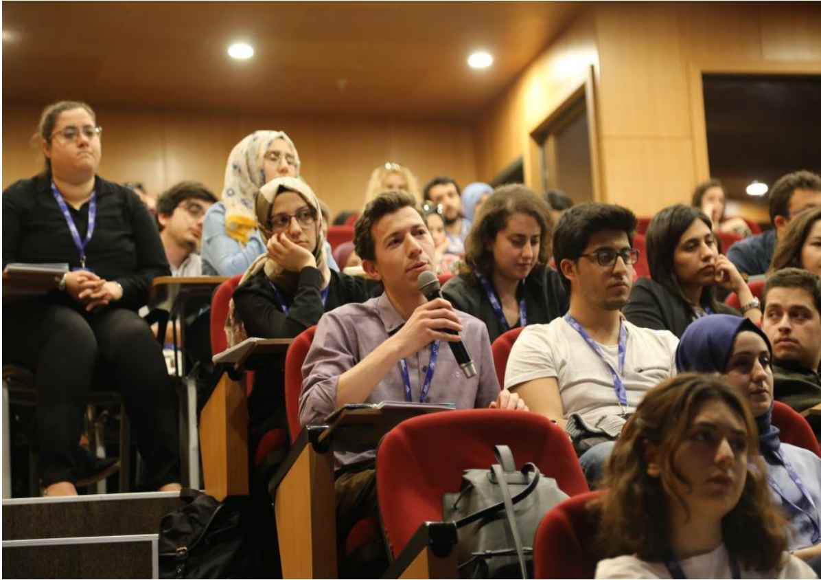
Resim: III. Tıp Öğrenci Kongresinin tanıtımı.