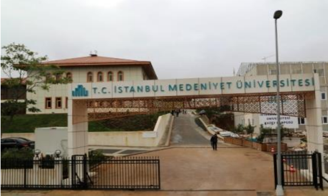
Resim: Üniversitemiz Kuzey yerleşke binasından görünüm.

*Amfilerden 1 adeti K Blokte bulunmaktadır.